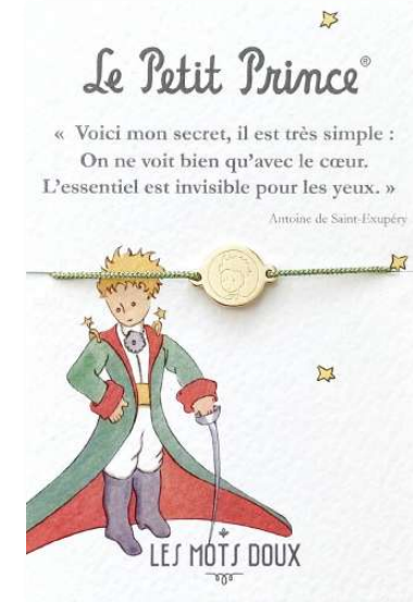
OR : BR-LEP-0005 / OR : BR-LEP-0006